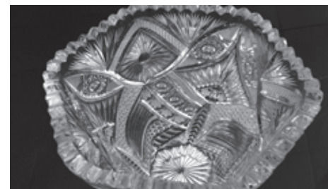
■ Krása a jednoduchost. To je broušené sklo od firmy Czechokristal