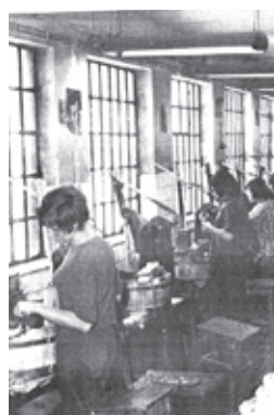
■ Brusírna olovnatého křišťálu