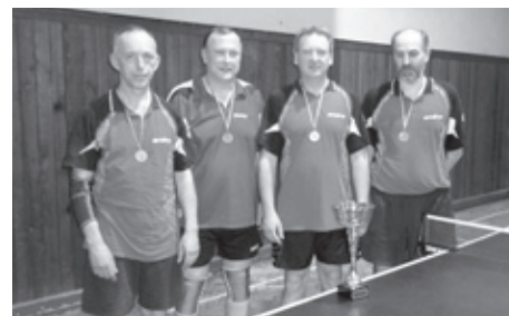
■ Vítězové s pohárem