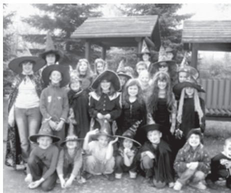
■ Slet čarodějníc

■ 28. 4. 2011- SLET ČARODĚJNIC – společná akce žáků odloučeného pracoviště ZŠ Vrchlického a dětí MŠ Ještěrka