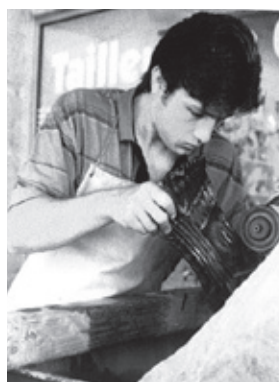
■ Nejmladší z rodu Kubinů